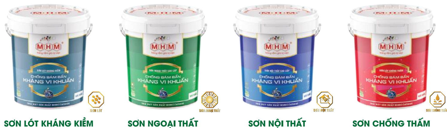
SƠN LÓT KHÁNG KIỀM SƠN NGOẠI THẤT SƠN NỘI THẤT SƠN CHỐNG THẤM